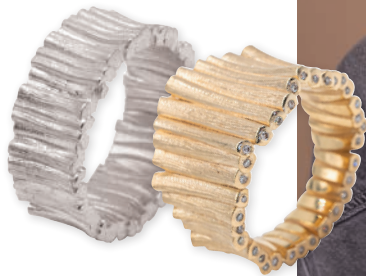
92193 Ring aus der Serie „FOREST“ small Sterlingsilber 925/- Dieser Ring hat eine strukturierte und glänzende Oberfläche. Der Ring erinnert an kleine Äste und eine Holzstruktur. € 199