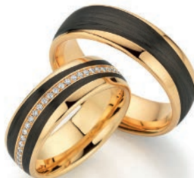
Trauringe Pure Glamour 585/Apricotgold mit Carbon 56 Diamanten im Brillantschliff Paarpreis UVP € 7.880