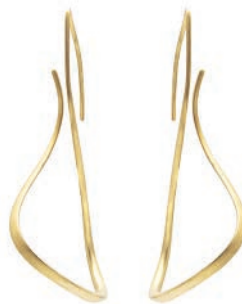
6027 Cascade Ohrschmuck „move“ in 585/- Gold Ohrschmuck aus der Serie „cascade“ in Gold. € 2.359