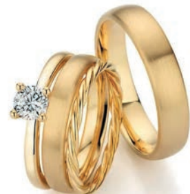
Trauringe 585/Apricotgold Paarpreis UVP € 3.170 Solitaire 585/Apricotgold 1 Diamant im Brillantschliff UVP € 2.915 Kordelring 585/Apricotgold UVP € 690