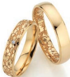
Trauringe Goldblüte 585/Apricotgold 1 Diamant im Brillantschliff Paarpreis UVP € 3.160