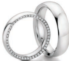
Trauringe Zuwendung 585/Weißgold 47 Diamanten im Brillantschliff Paarpreis UVP € 7.780