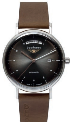
Bauhaus Herrenuhr 21622 Automatik mit Wochentagsanzeige und Lederarmband und Datum mit Lederarm- band. Gewölbtes Mineral K1 Sicherheits- glas. € 249