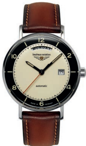
Bauhaus Aviation Vintage Pilot 24622 Automatik mit Wochentagsanzeige und Lederarmband. Gewölbtes Mineral K1 Sicherheitsglas. € 299