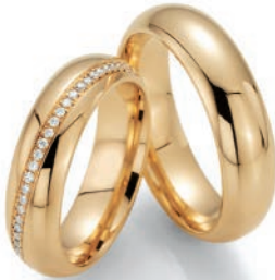
Trauringe Sehnsucht 585/Apricotgold 30 Diamanten im Brillantschliff Paarpreis UVP € 6.780