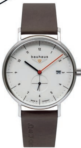
Bauhaus Classic 21301 Quarz mit kleiner Sekunde und Datum mit Lederarmband. Gewölbtes Mineral K1 Sicherheitsglas. € 249