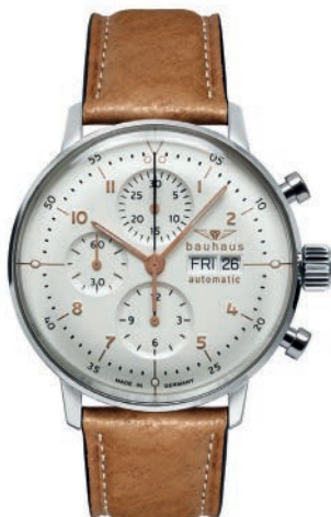
Bauhaus Dessau 20181 Automatik Chronograph mit Lederarm- band und weißem Zifferblatt. Gewölbtes Mineral K1 Sicherheitsglas. € 1.979