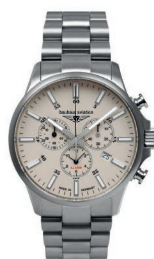
Bauhaus Aviation Titanium 2860M5 Automatik mit Gangreserveanzeige und Titan-Gliederarmband. Saphirglas. Klassische, analoge Flieger-Armbanduhr im Titan-Gehäuse. € 599