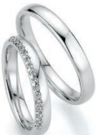
Trauringe Natürlichkeit 585/Weißgold 17 Diamanten im Brillantschliff Paarpreis UVP € 4.445