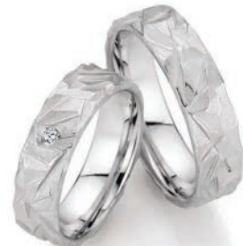
Trauringe Gletscherwelt 585/Weißgold 1 Diamant im Brillantschliff Paarpreis UVP € 6.410