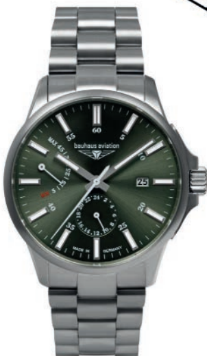
Bauhaus Aviation Titanium 2860M4 Automatik mit Gangreserveanzeige und Titan-Gliederarmband. Saphirglas. Klassische, analoge Flieger-Armbanduhr im Titan-Gehäuse. € 599