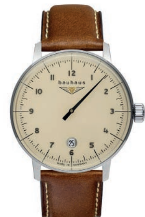
Bauhaus Herrenuhr Quarz Monotimer 20425 mit Datum und Lederarmband Schweizer Quarz-Uhrwerk ETA F06.111, 3 Steine. € 229