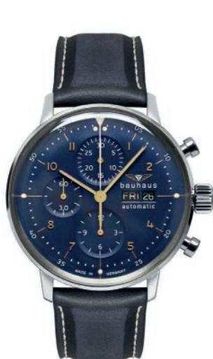
Bauhaus Dessau 20183 Automatik Chronograph mit Lederarm- band und blauem Zifferblatt. Gewölbtes Mineral K1 Sicherheitsglas. € 1.979