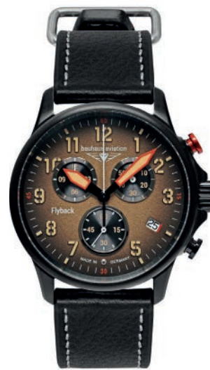
Bauhaus Aviation Blackwing 28885 Quarz Flyback-Chronograph mit Leder- armband. Schweizer Quarz-Uhrwerk ETA G10.212AN, 4 Steine. € 349