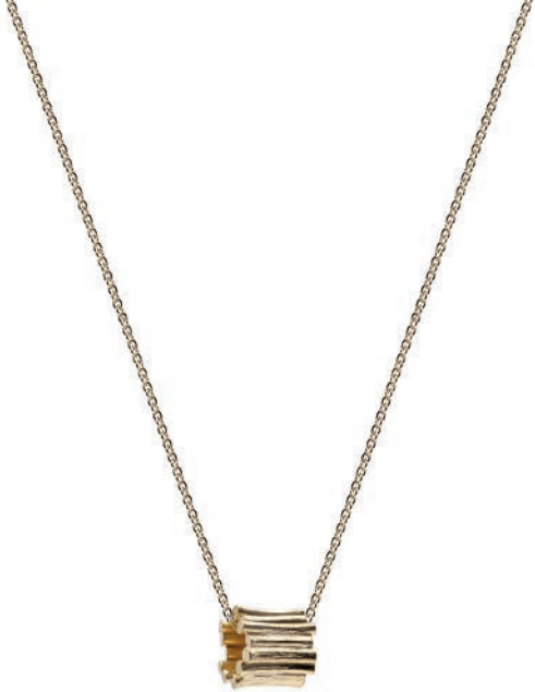
94212 Anhänger aus der Serie „FOREST“ Sterlingsilber 925/- vergoldet mit Kette 45cm. € 199