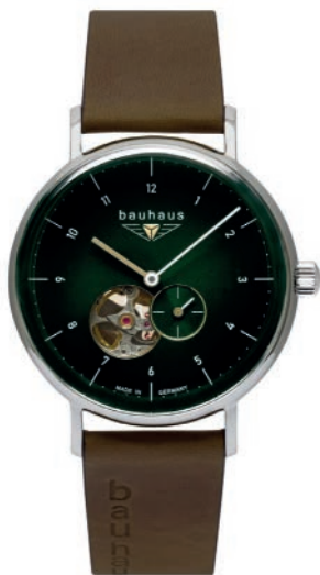
Bauhaus Classic 21664 Automatik mit Open Heart dunkelgrünem Zifferblatt und Lederarmband. Gewölbtes Mineral K1 Sicherheitsglas. € 299