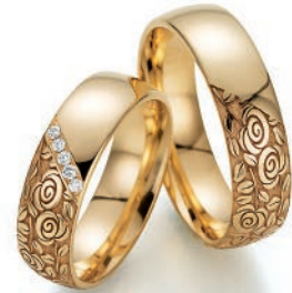
Trauringe Rosengarten 585/Apricotgold 5 Diamanten im Brillantschliff Paarpreis UVP € 4.760