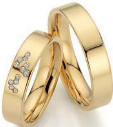
Trauringe Euphorie 585/Apricotgold 12 Diamanten im Brillantschliff Paarpreis UVP € 4.890