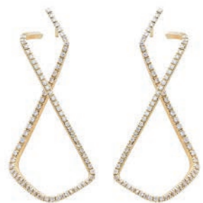
5057/125 Cascade Ohrschmuck „square“ in 585/- Gold mit Brillanten 1,25ct. TW-vs Ohrschmuck aus der Serie „cascade“ in Gold. € 5.289