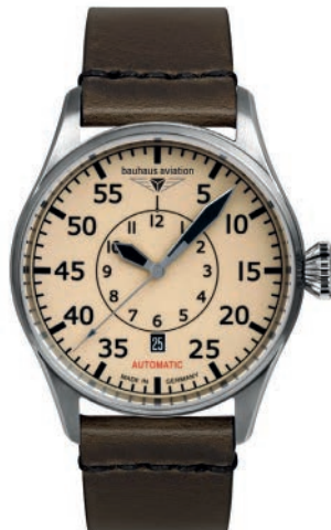
Bauhaus Aviation Flight Control 27565 Automatik mit Datum und Lederarm- band, beiges Zifferblatt das in der Nacht leuchtet und Saphirglas. € 599