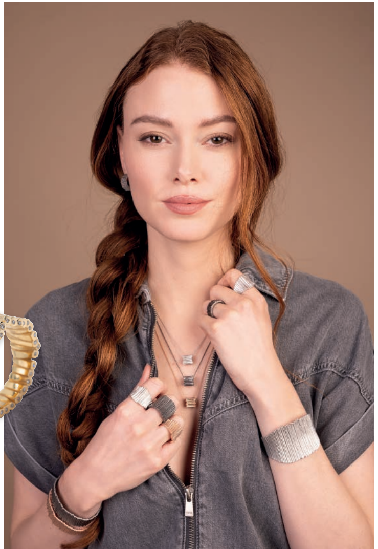
91153 Ring aus der Serie „FOREST“ small Sterlingsilber 925/- vergoldet mit Brillanten 0,17ct. Dieser Ring hat eine strukturierte und glänzende Oberfläche. Der Ring erinnert an kleine Äste und eine Holzstruktur. € 398

Feine Formen, edle Materialien und moderne Schlichtheit machen jeden Schmuck von noën zu einem besonderen Statement. Dezent, elegant und voller Ausdruck - für Ihren ganz persönlichen Glanz.