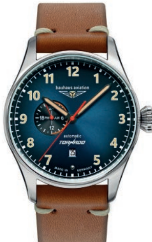
Bauhaus Aviation Tornado 27643 Automatik mit 24h-Anzeige und Leder- armband. Blaues Zifferblatt mit beigen, nachts leuchtenden Zahlen/Indices, Leuchtzeiger. Mineral K1 Sicherheitsglas. € 299