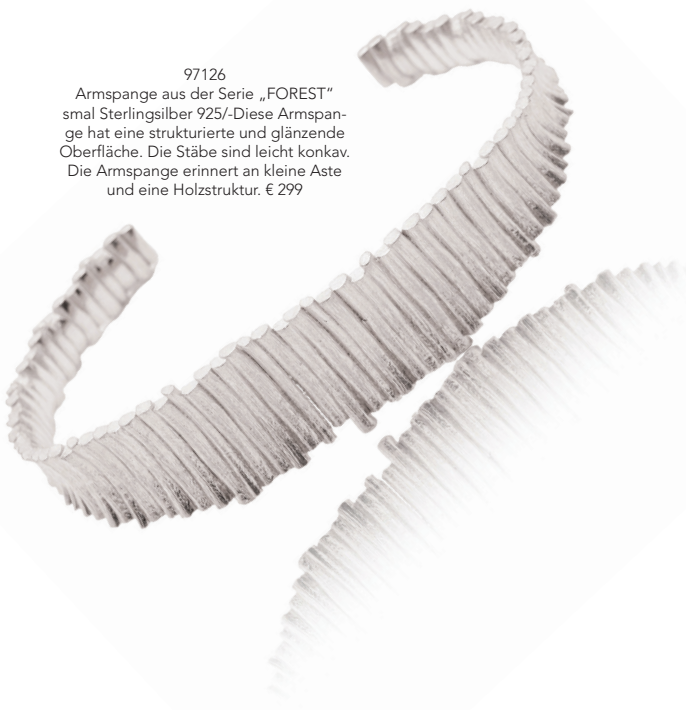
97126 Armspange aus der Serie „FOREST“ small Sterlingsilber 925/- Diese Armspange hat eine strukturierte und glänzende Oberfläche. Die Stäbe sind leicht konkav. Die Armspange erinnert an kleine Äste und eine Holzstruktur. € 299

Feine Formen, edle Materialien und moderne Schlichtheit machen jeden Schmuck von noën zu einem besonderen Statement. Dezent, elegant und voller Ausdruck - für Ihren ganz persönlichen Glanz.